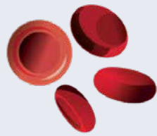
les globules rouges (qui transportent l'oxygène)

Les cellules souches fabriquent trois types de cellules sanguines :