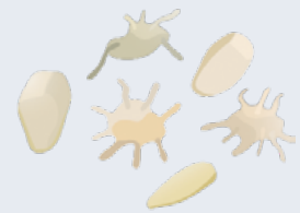
les plaquettes (qui permettent la coagulation du sang)